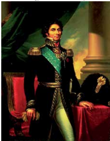
Carl XIV Johan

Jonas Collett, i Statsministerens Fraværelse. P. C. Holst.