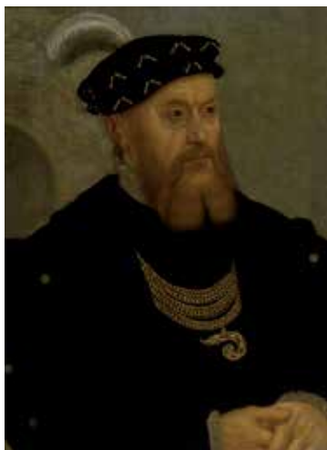
Christian 3. (Det Nationalhistoriske Museum Frederiksborg slot)