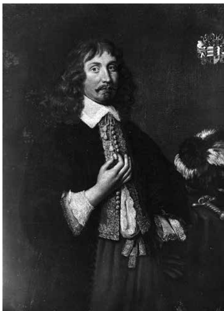
Ove Bjelke