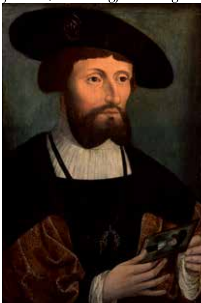
Christian 2. (Det Nationalhistoriske Museum Frederiksborg slot)

Nyere forskning har utfordret mange sider ved denne oppfatningen. Gjennom omfattende kildestudier og beregninger har man kunnet vise, at adelen slett ikke forsvant etter Svartedøden. Antallet stormenn gikk riktignok ned i senmiddelalderen - i Norge som i mange andre land.